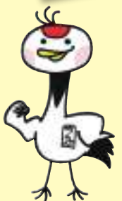
津商マスコットキャラクター 「トソーちゃん」